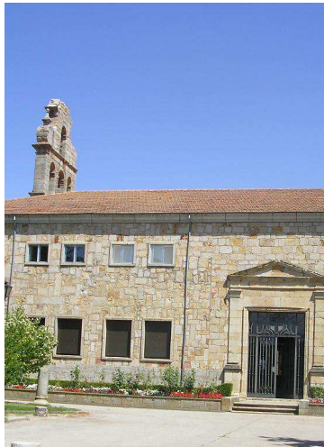
Colegio y Seminario San Jerónimo ALBA DE TORMES (España)

Dentro de la red de escuela dehonianas trabajaremos juntos cuatro centros, con un total de 300 alumnos: