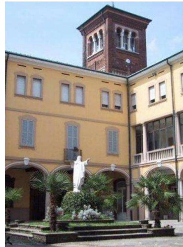
Liceo León Dehon MONZA (Italia)