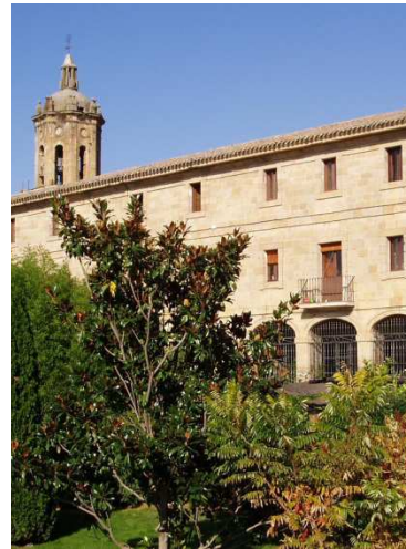
Colegio y Seminario PP. Reparadores PUENTE LA REINA (España)